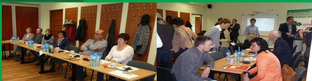
Spotkania dotyczące wsparcia oferowanego pracodawcom